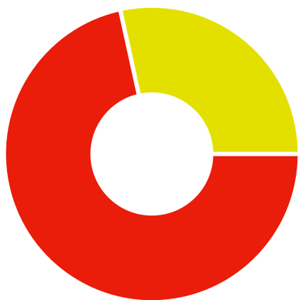
Ekvivalens energia fogyasztás

Villamos energia: 924 633 kWh PB-Gáz: 367 568,297 kWh