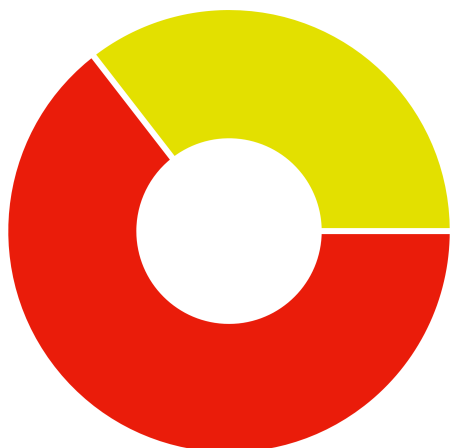
Ekvivalens energia fogyasztás